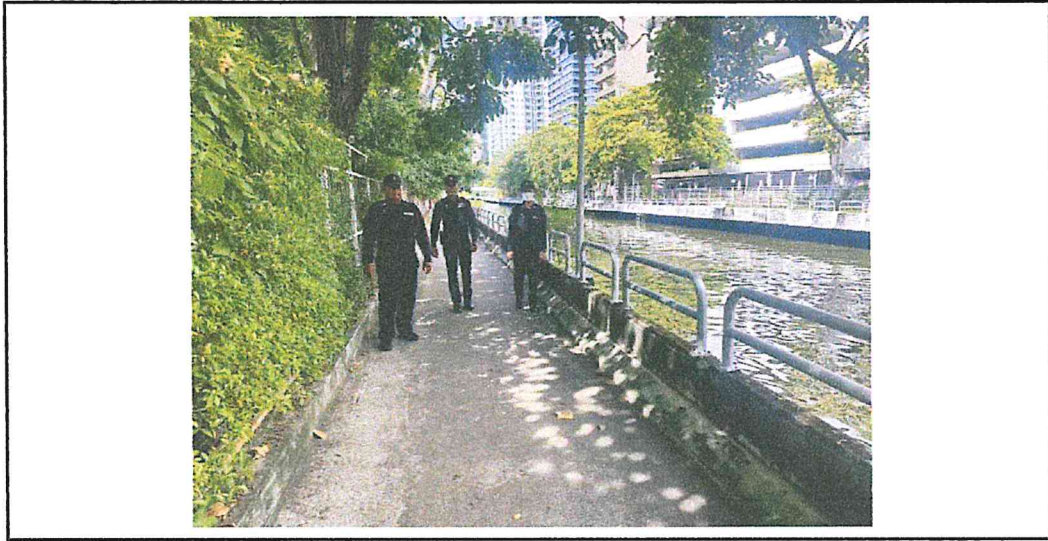
จุดเสี่ยงอาชญากรรม : ประตูน้ำข้าง มศว.