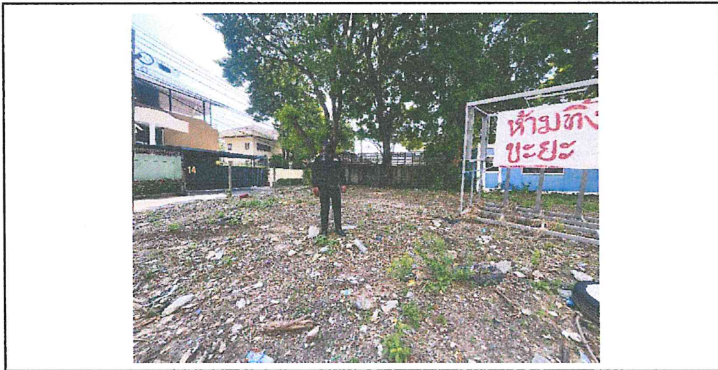
จุดรกร้าง/ลักลอบทิ้งขยะ : ซอยปรีดีพนมยงค์ ๒๖ แยก ๑๓