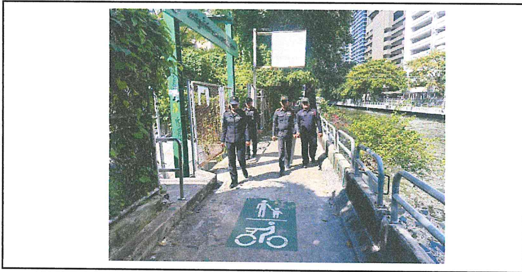
จุดเสี่ยงอาชญากรรม : ประตูน้ำข้าง มศว.