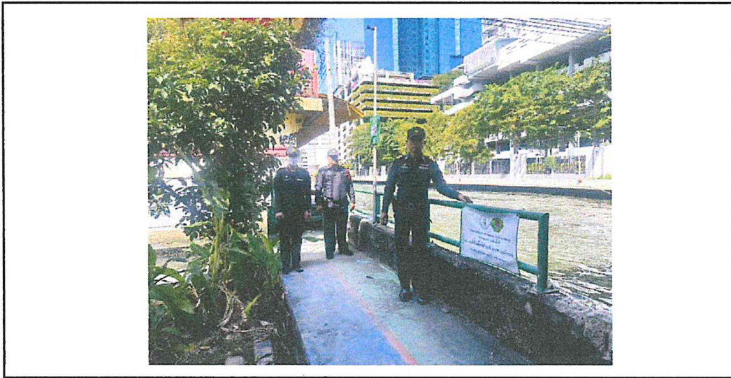
จุดเสี่ยงอาชญากรรม : สวนป่าเอกมัย