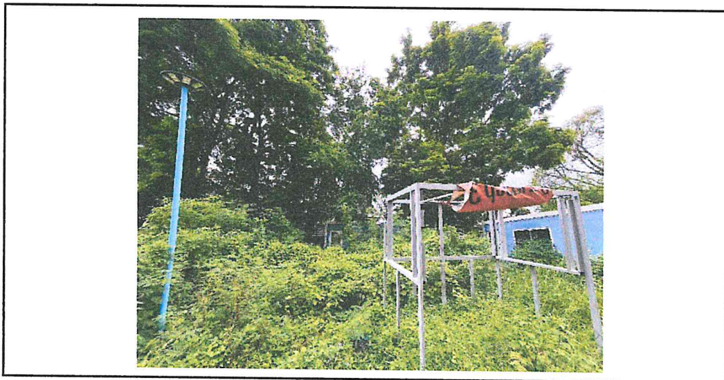
จุดรกร้าง/ลักลอบทิ้งขยะ : ซอยปรีดีพนมยงค์ ๒๖ แยก ๑๓